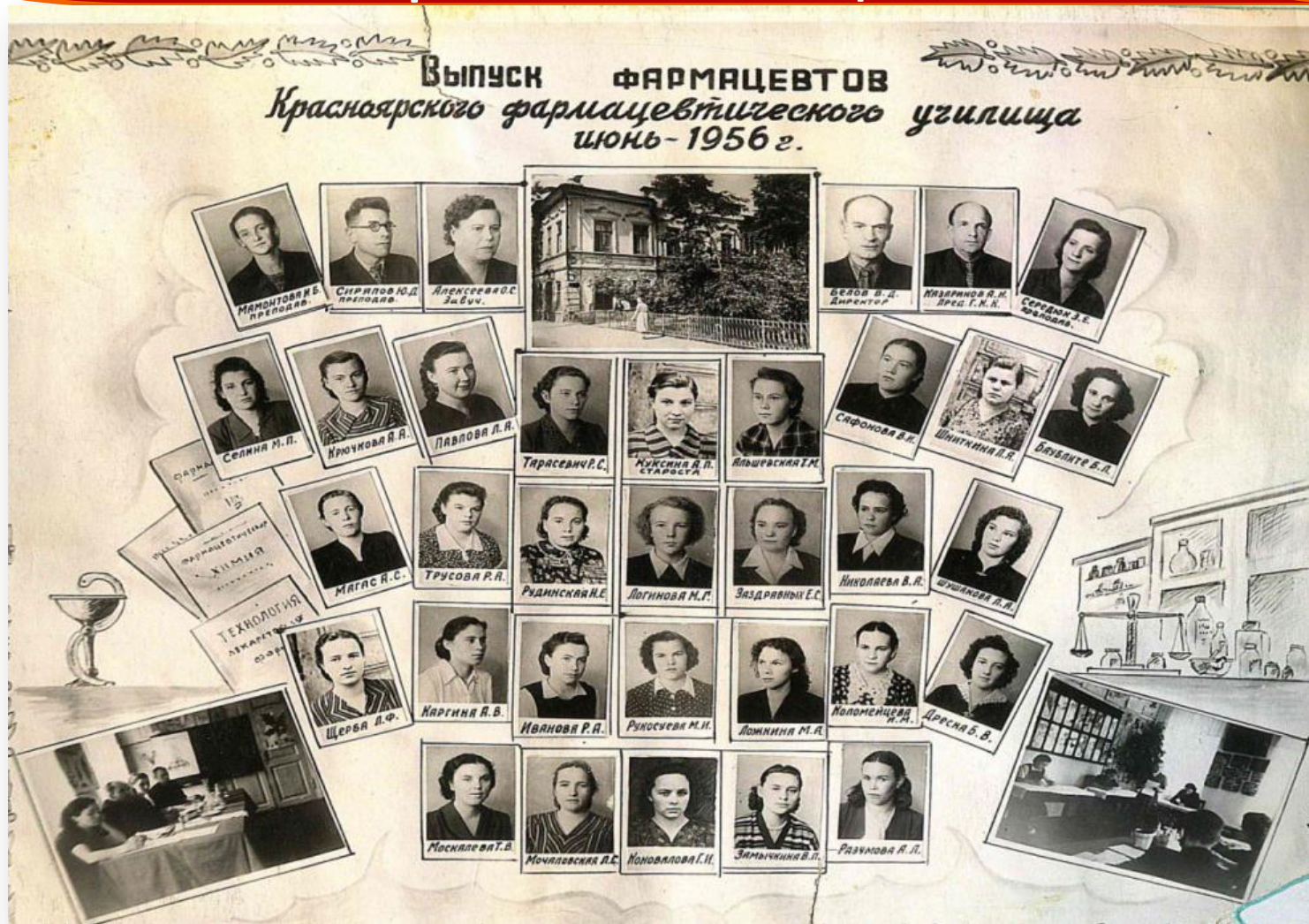
Первый выпуск фармацевтов Фармацевтического училища 1956 год.