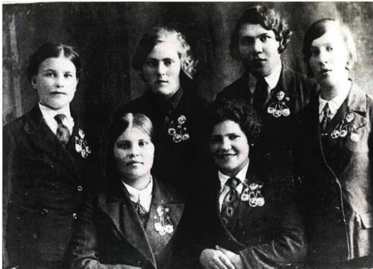
УЧАЩИЕСЯ СО ЗНАЧКОМ «ВОРОШИЛОВСКИЙ СТРЕЛОК», УШЕДШИЕ НА ФРОНТ