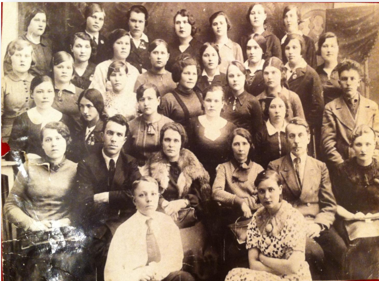
1938г.- Первый выпуск специалистов Фармацевтической школы - 30 человек