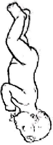
3. Выкладывание на живот.