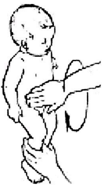
5. Массаж живота. (6-8 мес)