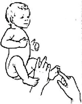
6. Массаж стоп и предплюсневых выпячиваний стоп. (3-4 мес)