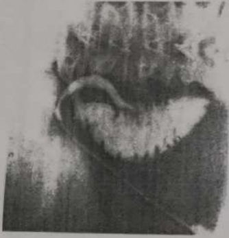
Рис. 2. Интраоперационная холангиограмма. Общий желчный проток не расширен, дефектов наполнения в нем нет, контрастное вещество свободно поступает в двенадцатиперстную кишку

Камни диаметром менее 1 см, как правило, отходят спонтанно в течение 48 ч. Если их размеры превышают 2 см, обычно требуется выполнение литотрипсии. При невозможности эндоскопической коррекции показано оперативное вмешательство.