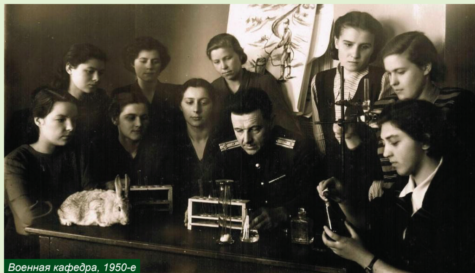
Военная кафедра, 1950-е

29 000 СТУДЕНТОВ ПРОШЛИ ВОЕННУЮ ПОДГОТОВКУ НА КАФЕДРЕ С 1942 ГОДА.