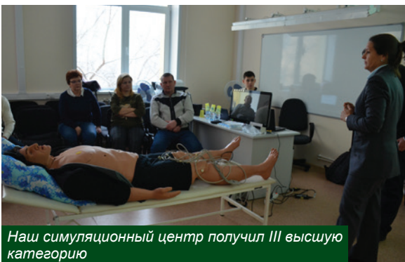
Наш симуляционный центр получил III высшую категорию

На ближайшей сессии ЗС 20 февраля 2020 года проект будет представлен вниманию краевых законодателей. Я вас обязательно проинформирую об этом знаменательном событии.