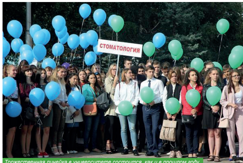
Торжественная линейка в университете состоится, как и в прошлом году

Что касается профилактики инфицирования – ведь коронавирус никуда не делся – преподавателей обеспечат санитайзерами и масками.