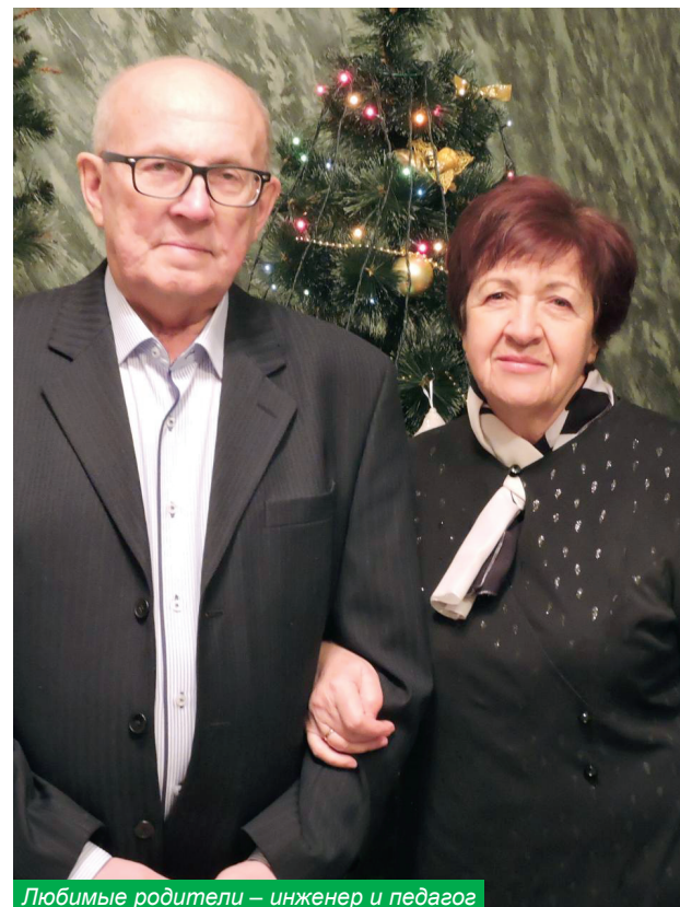
Любимые родители – инженер и педагог