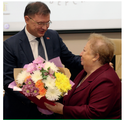
Наш ректор был в прекрасном настроении