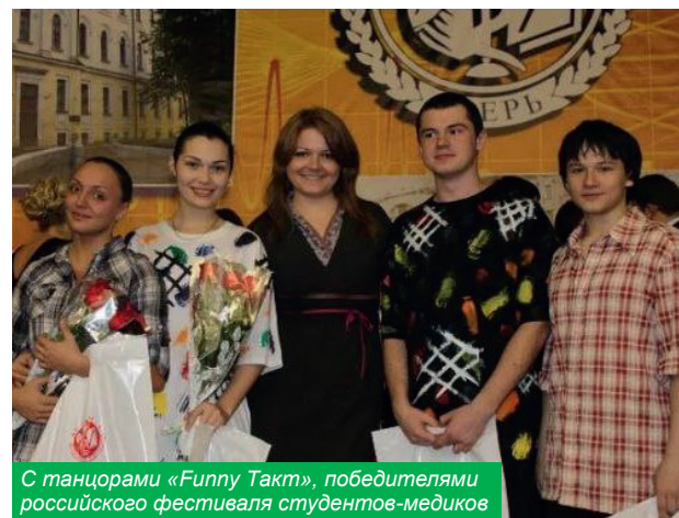
С танцорами «Fupny Такт», победителями российского фестиваля студентов-медиков

Что примечательно – мои артисты выросли в прекрасных врачах. Правду говорят, что талантливые люди талантливы во всем.