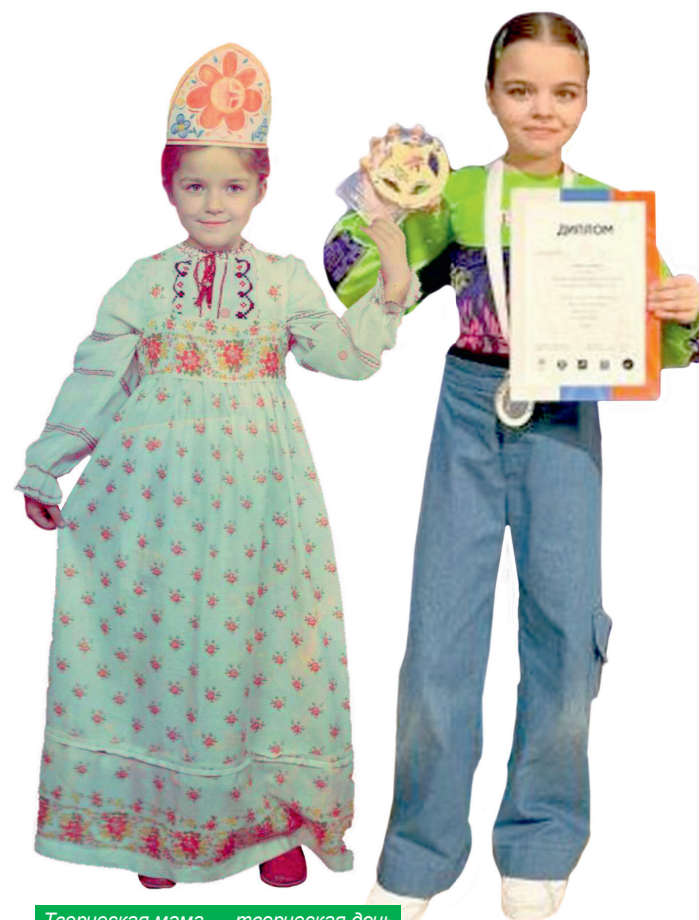
Творческая мама — творческая дочь