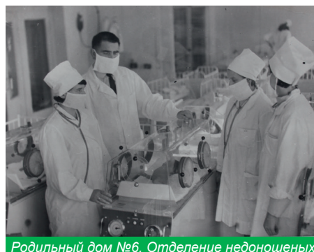
Родильный дом №6. Отделение недоношенных