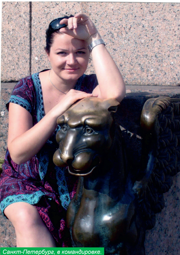
Санкт-Петербург, в командировке.

Есть люди, у которых доброта как аура, человек в ней с рождения, словно в облаке, и любому ясно – ничего плохого от него ждать не приходится.