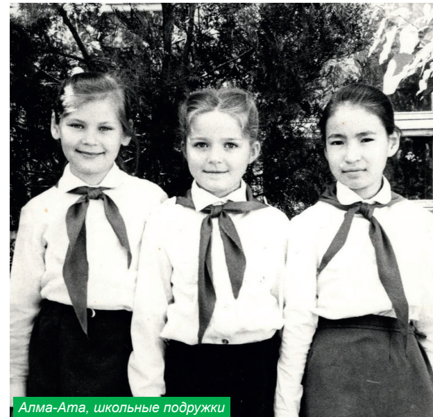
Алма-Ата, школьные подружки

Хорошо, что мы даем студентам возможность реализовать свой талант. Приятно, что студенты в шутку называют наш Молодежный центр «выпускающей кафедрой» – из-за большого количества успеш-