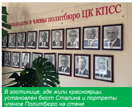
В гостинице, где жили красноярцы, установлен бюст Сталина и портреты членов Политбюро на стене

он, конечно, бесплатно. И только когда уезжал, выяснилось, что это человек из команды представителя Президента по Дальневосточному федеральному округу.