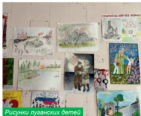
Рисунки луганских детей

– Я видела луганских студентов, у них взрослые глаза. Рассказывала им о нашей внеучебной работе и получила вопрос: «А на учебу вашим студентам времени хватает?»