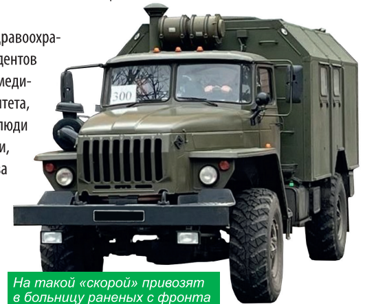
На такой «скорой» привозят в больницу раненых с фронта

В Луганском здравоохранении, включая студентов и преподавателей медицинского университета, сконцентрированы люди невероятной смелости, мужества и чувства долга. Врачебный костяк составляют местные, приезжают молодые бригады из Москвы, которая является