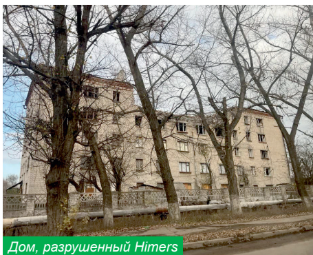
Дом, разрушенный HIMERS

Луганские ребята вызывают большое уважение – они ведь могли переехать, учиться в других вузах, но они любят Донбасс, хотят жить на своей земле и служить родному городу.