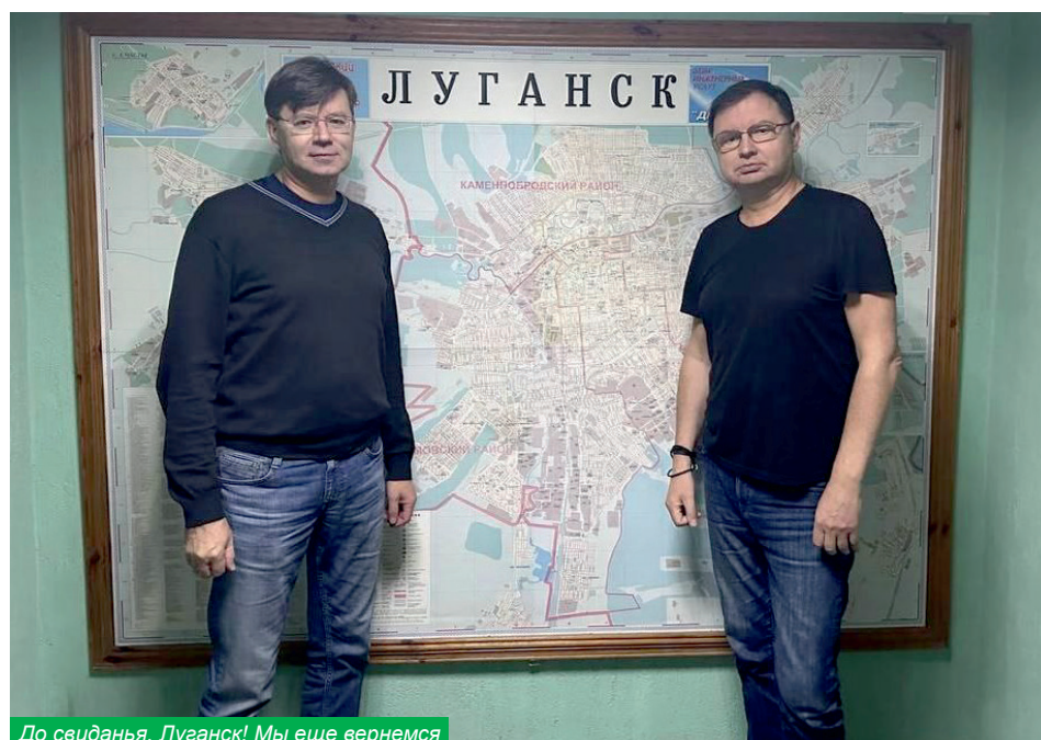
До свиданья, Луганск! Мы еще вернемся

Печально видеть военный Луганск и людей, которые так много пережили. Но были очень приятные моменты. Медицинский университет нуждается в методических рекомендациях, сложно от прежних программ переходить на новые рельсы, стать частью российской высшей школы. И мы можем помочь луганчанам. Они организовали для нас ученый совет, где я познакомила коллег с нашими учебными тех-