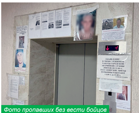
Фото пропавших без вести бойцов