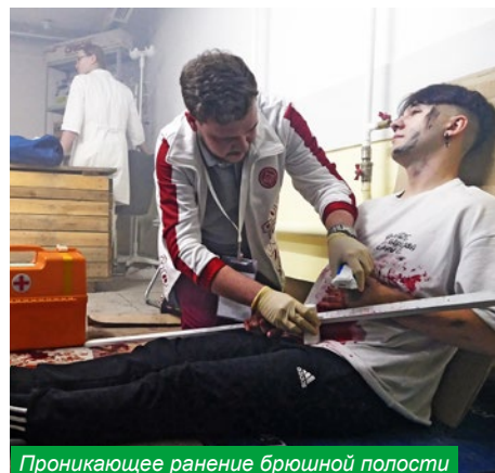
Проникающее ранение брюшной полости