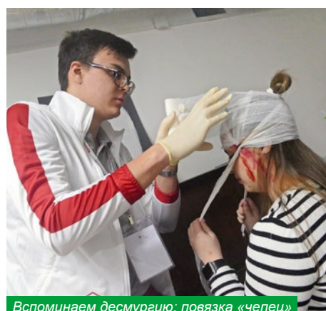
Вспоминаем десмургию: повязка «чепец»