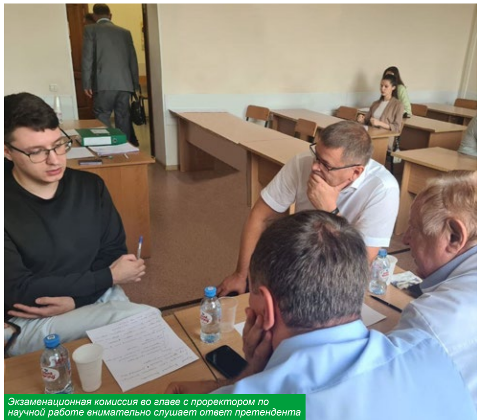
Экзаменационная комиссия во главе с проректором по научной работе внимательно слушает ответ претендента

Нужно отметить, что экзамены аспирантов мало похожи на студенческие — профессора