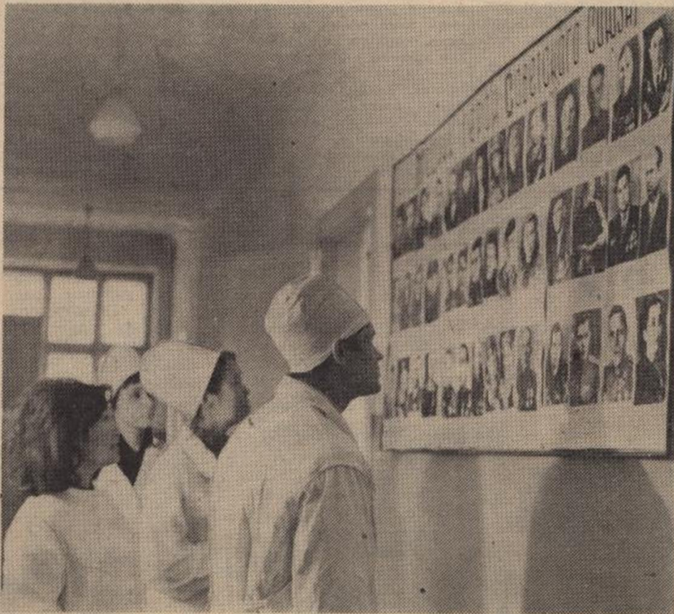
На снимках: слушатели военно-патриотической секции у стенда «Медики — Герои Советского Союза»; о