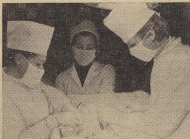
Эксперимент проводят сновцы кафедры общей хирургии.

6 СЕНТЯБРЯ В ДК «КОМБАЙНОСТРОИТЕЛЬ» СОСТОИТСЯ ТРАДИЦИОННЫЙ ДЕНЬ ПЕРВОКУРСНИКА НАШЕГО ИНСТИТУТА. НАЧАЛО В 15.00.