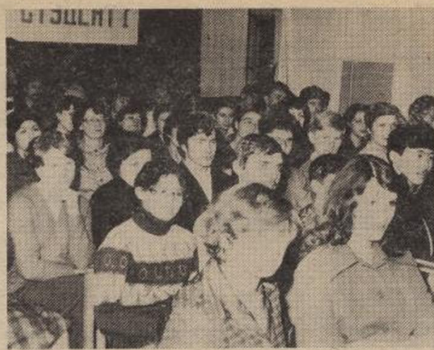
Закончился первый год культуры общественных профессий. Он показал, насколько актуальной и жи-