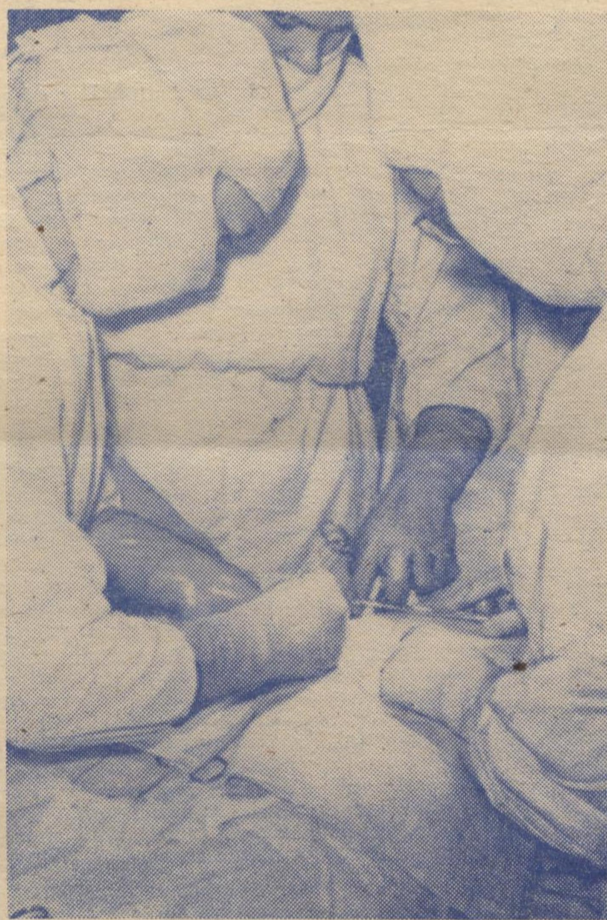
НА СНИМКЕ: учимся врачевать.