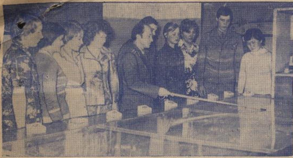
На снимке: хорошо налажен учебный процесс на военной кафедре, коллектив которой не один раз выходит победителем социалистического соревнования.