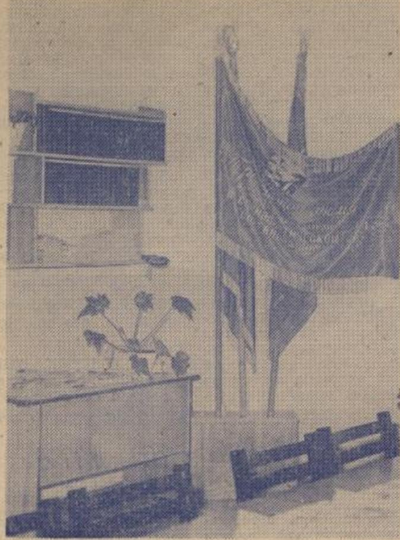
На снимке: уголок в Ленинской комнате Дома студентов № 4.

(Из призывов ЦК КПСС к 64-й годовщине Великой Октябрьской социалистической революции).