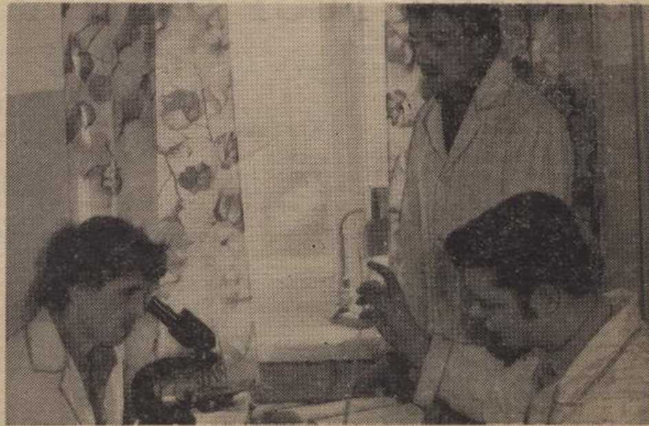
Уирс на кафедре патофизиологии.