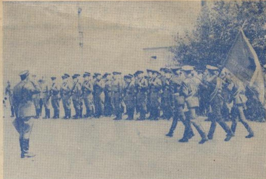
НА СНИМКЕ: летние учебные сборы, вынос знамени части.