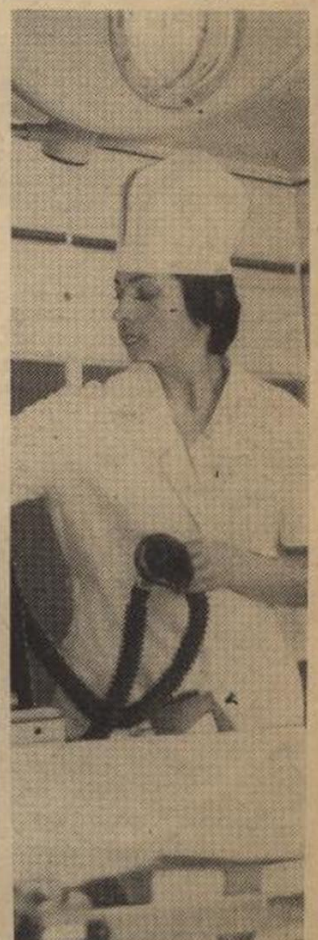
Редактор А. НЕБОГАТОВ.

Новый метод диагностики заболеваний, предложенный учеными Белорусского НИИ кардиологии и внедренный в клиниках Минска и других городов страны, основан на оригинальном принципе. Исследователи обратили внимание, что биологически активные вещества, содержащиеся в выдыхаемом воздухе, чутко реагируют на изменение самочувствия человека и несут информацию о состоянии его сердечно-сосудистой и дыхательной систем во многих случаях не хуже, чем кровь.