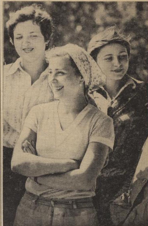
Запишите меня в стройотряд...