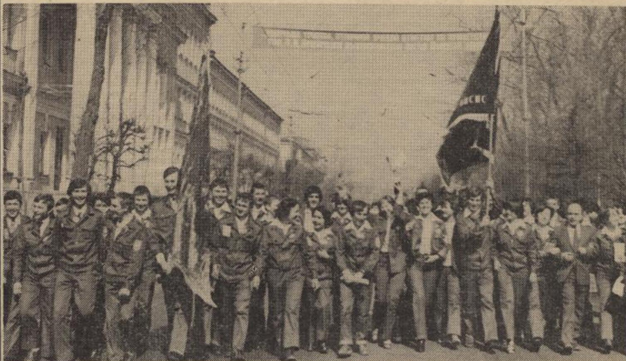
Наш адрес — Советский Союз.