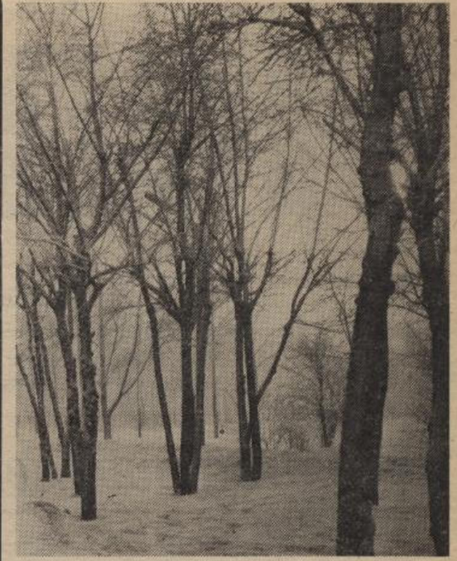
ЗИМА.

Учитывая уникальное своеобразие профессии врача с этических позиций, известный русский юрист А. Ф. Кони писал: «...можно с полным правом говорить об отдельной и важной отрасли знания, необходимой для врача — о врачебной этике. Достаточно лишь указать на такие вопросы, как о врачебной тайне, о явке к больному, о пределах сохранения секрета научно-врачебных открытий и т. д., чтобы увидеть всю важность этой отрасли профессиональной этики».