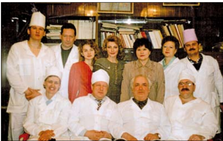
Коллектив кафедры общей хирургии, 1996 г.