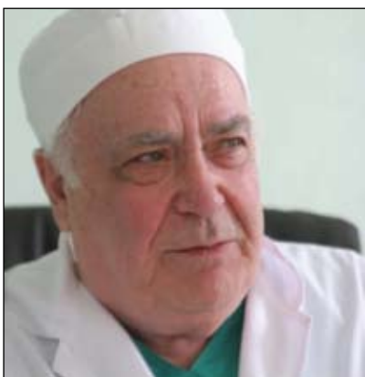
Так выглядит юбиляр в наши дни...