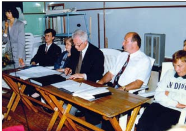
Презентация учебного круиза на теплоходе «Александр Матросов», 1997 г.

Так, например, была создана кафедра анестезиологии и реаниматологии детского возраста,