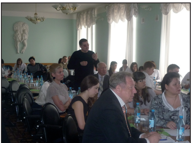
Секция «Актуальные вопросы хирургии № 2»