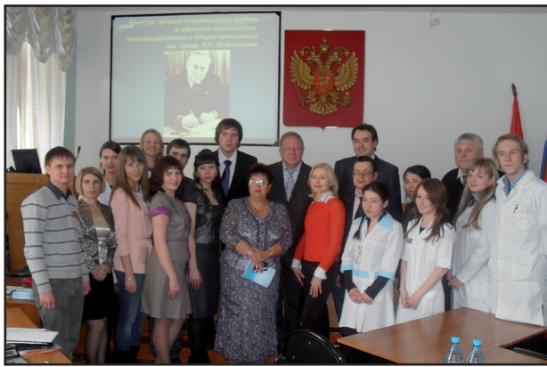
Конкурс лучших студенческих работ в области гистологии, патоморфологии и общей патологии им. проф. П. Г. Подзолкова