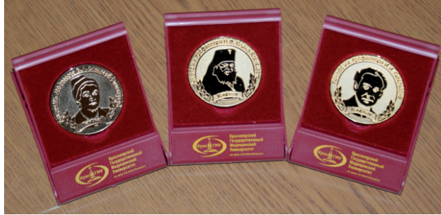
Медали лауреатам именных конкурсов

А это значит, что почти половина студентов Красноярского государственного университета ещё со студен-