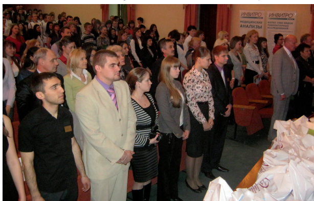
Торжественное пленарное заседание, посвящённое закрытию конференции, и награждение победителей