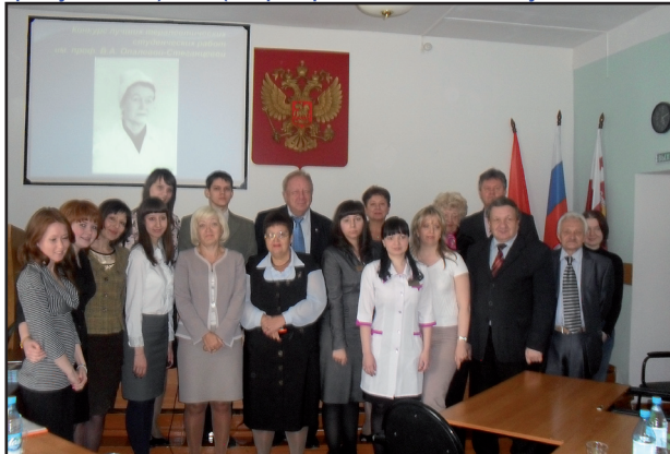
Конкурс лучших терапевтических студенческих работ им. проф. В. А. Опалевой-Стеганцевой