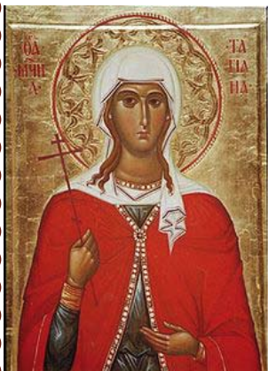
Икона Св. Татианы

С 2005 года 25 января отмечается в России как День российского студенчества.