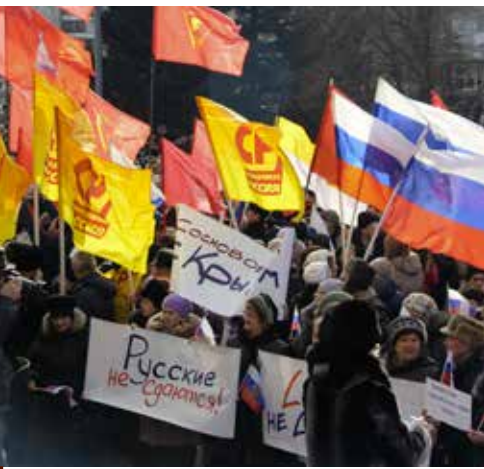
Мы – вместе! (см. 4-ю стр.)