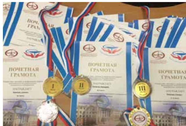
Награды ждут победителей...