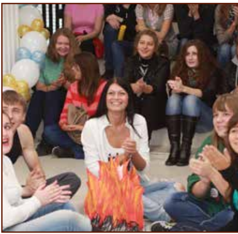
Так мы отдыхаем...