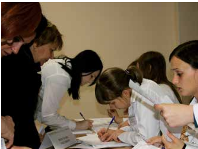
Так мы учимся...

– факультетом довузовского и непрерывного профессионального образования (см. 4-ю стр. номера).