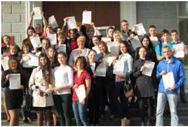
С дипломом ММА – да хоть куда!