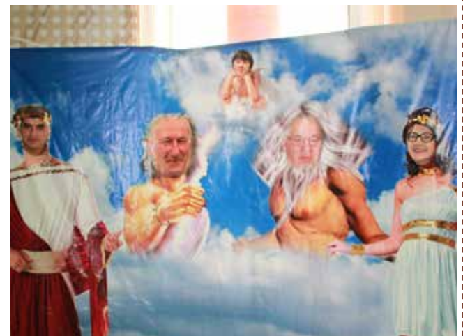
Так отмечаем праздники...