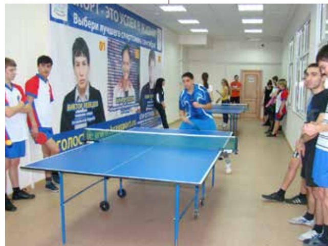
Так мы занимаемся спортом...