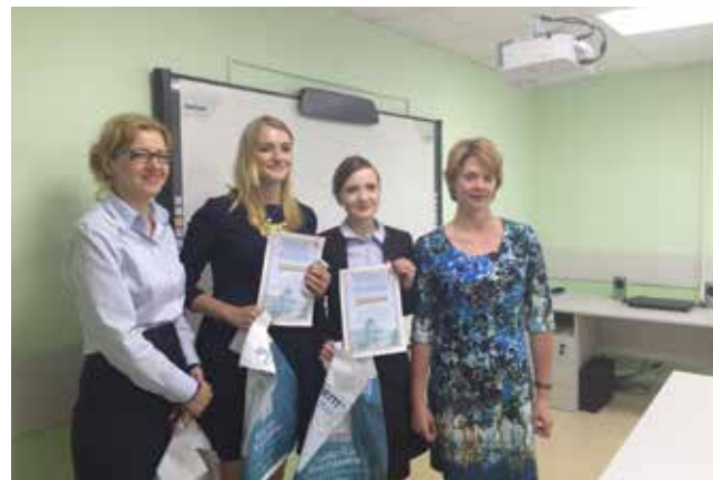
Факультет довузовского и непрерывного профессионального образования Красноярского государственного медицинского университета имени проф. В.Ф. Войно-Ясенецкого