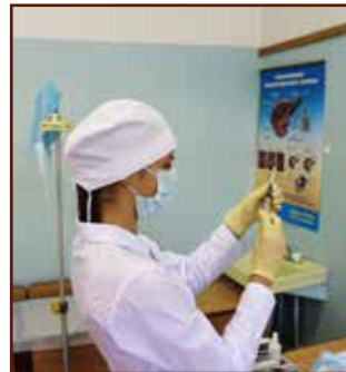
Сдача итогового зачета.