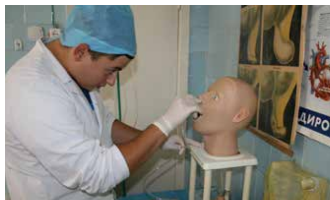
Сдача практических навыков.